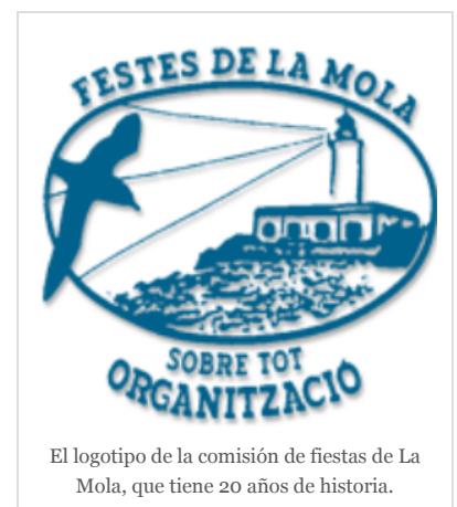
El logotipo de la comisión de fiestas de La Mola, que tiene 20 años de historia.