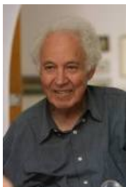
Josep Planells 'Pep Negre', poeta y sacerdote.